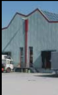
WINI BÜROMÖBEL, MARIENAU: Produktion und Verwaltung auf über 4.000 qm. Die Fertigstellung erfolgte termingerecht – zum Festpreis.