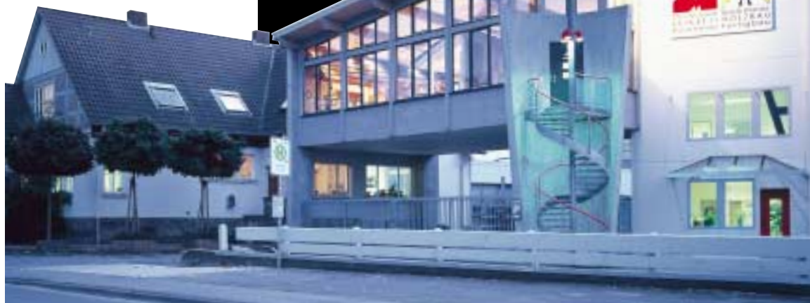
MEISTERSTÜCK HAUS, HAMELN: Der Hauptsitz des Unternehmens Otto Baukmeier in der Ohseener Straße verbindet Tradition und Innovation.