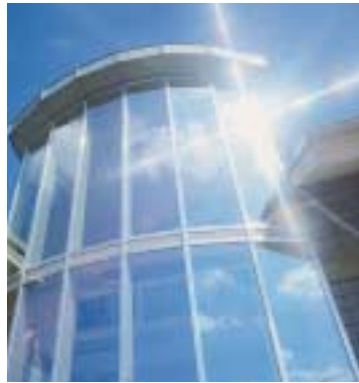
BLUMEN-EHLERDING, HAMELN: In nur 6 Wochen Bauzeit entstand dieser einzigartige Einkaufsmarkt. Individuell und kundenorientiert.